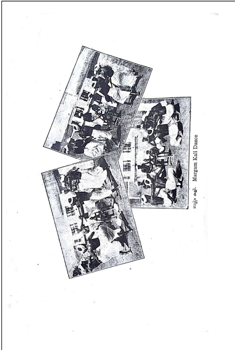
Margam Kali Dance

CHRISTIAN MUSICOLOGICAL SOCIETY OF INDIA