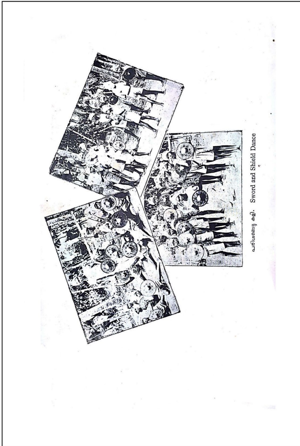
പരമേശ്വരൻ കല്ലി. Sword and Shield Dance

CHRISTIAN MUSICOLOGICAL SOCIETY OF INDIA